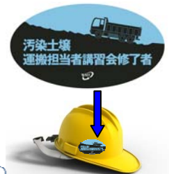
ヘルメット用シールと表示の例

●車両表示シール用のマグネットシートを用意しています。【金額：700円/2枚1組】