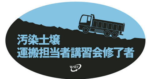
ヘルメット用シールと表示の例