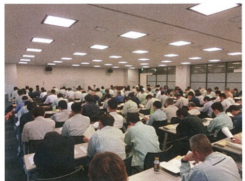
講習状況（主催：自治体）