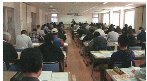
講習状況（主催：小規模な建設業者の団体）